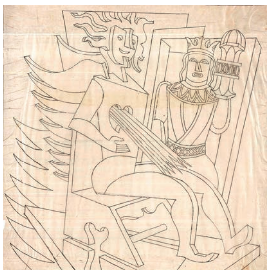
Fig. 3. Ángel del Cabaret del diavolo 1922-30. Tinta/papel 55 x 54,5 cm. Fondo Depero, Mart Rovereto.