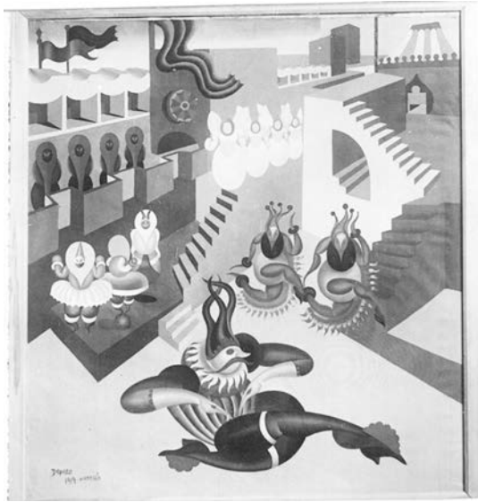
Fig. 8. Fortunato Depero. Diavoli di caucciù a scatto (Viareggio, 1919), (Negativo 90).

mecánico para el Teatro plástico, que aparecería en los murales del Infierno, preliminar que había tenido su traslación en una serie de cuadros y dibujos como Ballo di diavoli d'accaio, equilibristi e ballerine di gomma (1919, carboncillo/papel, 70 x 130 cm. Mart, Rovereto) –mostrado en la Esposizione Nazionale Futurista di Milano ese año–; Diavoletti di caucciù a scatto (1919, óleo/tela, 125 x 110 cm, colección privada) (fig. 8), cuyos bocetos datan del año anterior y el Ballo favoloso (1919, lápiz/papel, 43 x 60 cm. Mart, Rovereto), que tendría su versión en los murales del Infierno. Otros elementos iconográficos similares aparecen en Diavolo a caucciù (1920, paño de lana aplicado sobre algodón, 60 x 58,5 cm, colección privada), que partía de la escenografía del Teatro plástico; Diavolo nero (1920, paño de lana aplicado sobre algodón, 43 x 38 cm, colección privada), que le vendió por mil liras a Fedele Azari (1895-1930) y Maschere tropicali (1920, lápiz/papel, 13,5 x 5,5 cm, colección privada).