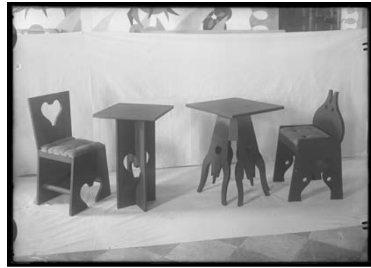
Fig. 11. Muebles del Cabaret del Diavolo Roma 1922 (Negativo n° 137).

de su confianza y realizó, según anotó Depero, cien sillas, diecisiete bancos, treinta mesas, cuarenta estructuras de madera –entre las que se encontraba el citado reloj– y dieciséis pantallas y lámparas. Gracias a las fotografías que se hicieron en la Casa Keppel tenemos conocimiento de la intervención. Además de los muebles, diseñaría treinta marionetas que compondrían las tres decoraciones del horno de los condenados, la escalinata de los ángeles y el Paraíso.