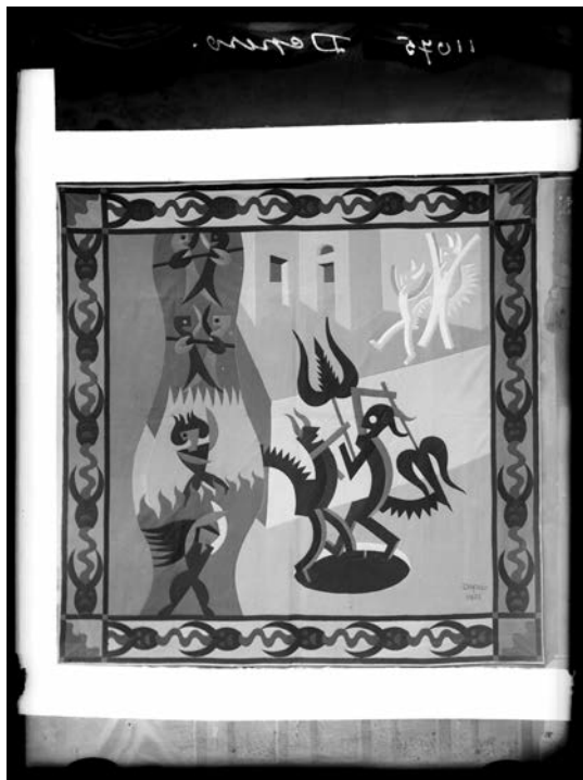
Fig. 1. Diavoletti Neri e Bianchi (1923). Tápiz. Negativo 190. Algodón sobre lienzo, 185 x 182 x 4 cm. (Negativo 190). Fondo Fortunato Depero. Archivo del '900, Mart, Rovereto.

Diavoletti Neri e Bianchi (1922) es una de las imágenes que sobrevivieron a la diáspora del Cabaret del Diavolo (1922-1925). El tapiz recrea dos diablillos danzantes con tridentes que emergen de un gran agujero negro. En la parte izquierda, un serpenteante haz de llamas abrasa a los condenados, hecho sobre el que se regocijan dos diablillos blancos. La composición trasladaba la escarpada imaginaria de la arquitectura popular de Campania que Depero había estudiado en Capri e iniciaría su atención por los espacios escenográficos que determinarían lo que Gabriella Belli ha denominado una estética de lo mágico 2 (fig. 1). El tapiz se completa con la silla y la mesa del Infierno creado por Depero y Gori en su interpretación dantesca.