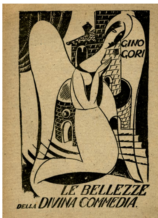
Fig. 2. Gino Gori. Le bellezze della Divina Commedia . Casa d'Arte Bragaglia, Roma, 1921. Portada de Sigismundo Olesevich. Archivio di Nuova Scrittura, Collezione Paolo della Grazia, Mart Rovereto.

Mediante Depero, Gori pensaba componer una metafórica fosa como las que señalaba el octavo círculo del Infierno de Dante. 53 El poeta florentino había sido uno de los blancos del futurismo, retomando la política de los agitadores Giovanni Pa-