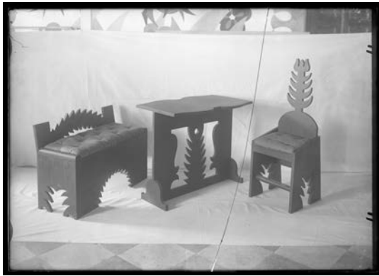
Fig. 10. Muebles del Cabaret del Diavolo, Roma 1922 (Negativo n° 136).