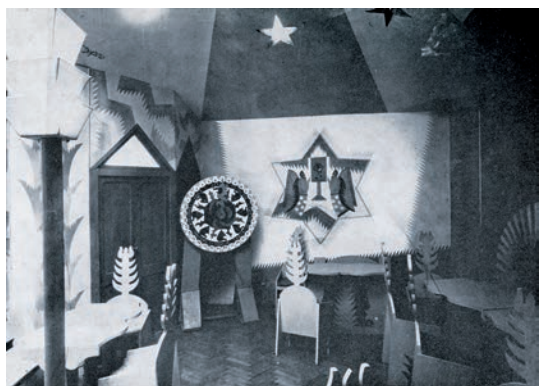
Fig. 6. Particular del Purgatorio (1922).