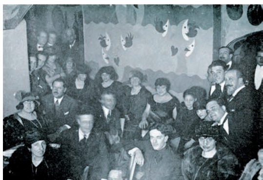
Fig. 5. Particular del Purgatorio . A la derecha Vittorio de Sica.