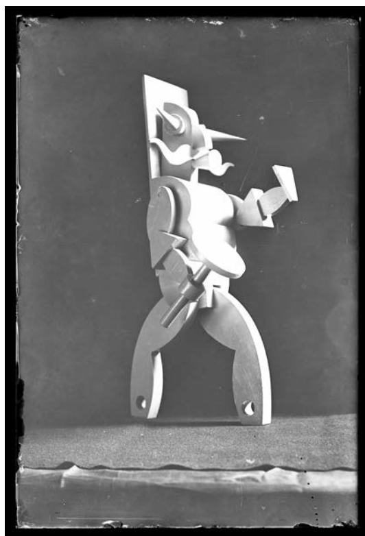
Fig. 7. Fortunato Depero. Diavolo (1925). (Negativo 163). Fondo Fortunato Depero. Archivio del '900, Mart, Rovereto.