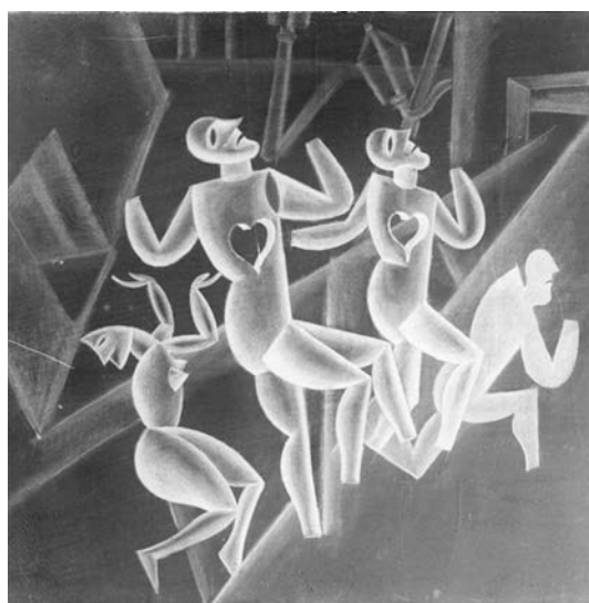
Fig. 4. Fortunato Depero. Ballo dei cuori (1919). Carboncillo (Negativo 190). Fondo Fortunato Depero. Archivio del '900, Mart, Rovereto.