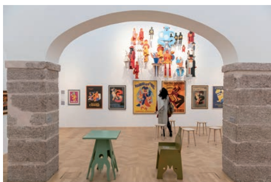
Fig. 16. Mesa y silla originales del Cabaret del Diavolo (1922) en la muestra Depero e la sua casa d'arte , Rovereto, 2021.

mentos del Cabaret del Diavolo se trasladaron a proyectos publicitarios de lápices, portadas de revistas –como su propuesta para Vanity Fair (1929-1930)– mientras que los comedores de corazones decorarían tapices y proyectos en tela. En el caso concreto de los ángeles del Paraíso, éstos se reconvertirán en motivos ornamentales y pictóricos a partir de los cuarenta. 91 Tras su segundo viaje a los Estados Unidos, la iconografía de sus pinturas recordaría el ambiente onírico que había definido su intervención romana.